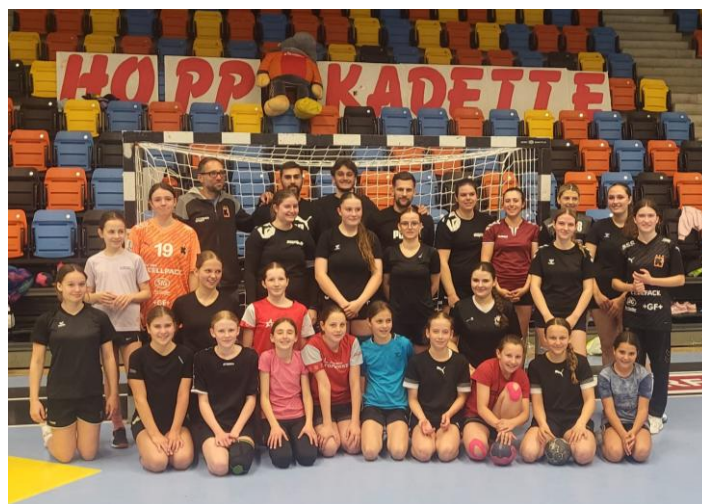
Training mit Nati A

Offen ist derzeit noch die Trainerfrage. Die Vereinsführung sucht mit Hochdruck nach einer passenden Lösung. Bis dahin organisieren wir das Training selbstständig, um uns optimal auf die neue Spielzeit vorzubereiten. Wer weiss – vielleicht greifen wir schon bald wieder nach dem Aufstieg in die 2. Liga.